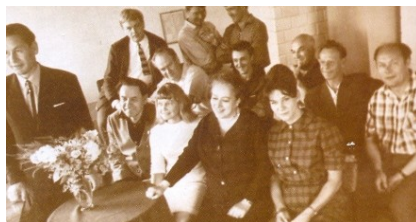
Встреча коллектива театра с сотрудниками газеты «Родянска Волянь», г. Луцк. Гастроли театра. 1967 г.