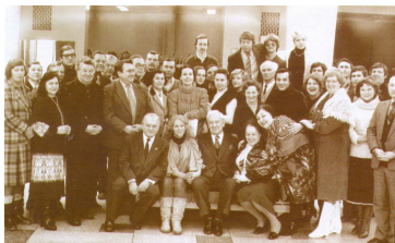
Нар. артист СССР М.И. Царёв с театральными коллективами Ульяновской области в январе 1984 г.

«Трагедия театра в том, что он жив, пока живы его актёры, - сказал Юрий Копылов. – Через Лию Ефимовну в нашем театре проходила связь с теми актёрами старшего поколения, которых во МХАТе называли «великими стариками».