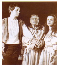
Брат Лоренцо, «Ромео и Джульетта» У. Шекспира

Кучумов – в драме А. Островского «Бешеные деньги»; Вурм и Миллер – в драме В. Шекспира «Коварство и любовь».