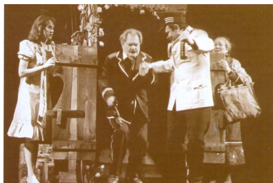
Тоот, «Тоот, майор и другие» И. Эркения