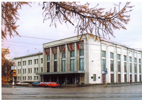
Ульяновский драматический театр